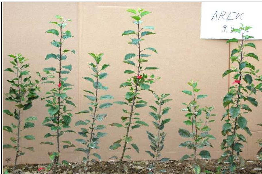
Apfelsämlinge nach ca. 5 Monaten: Habitus und Gesundheit sind sehr unterschiedlich .